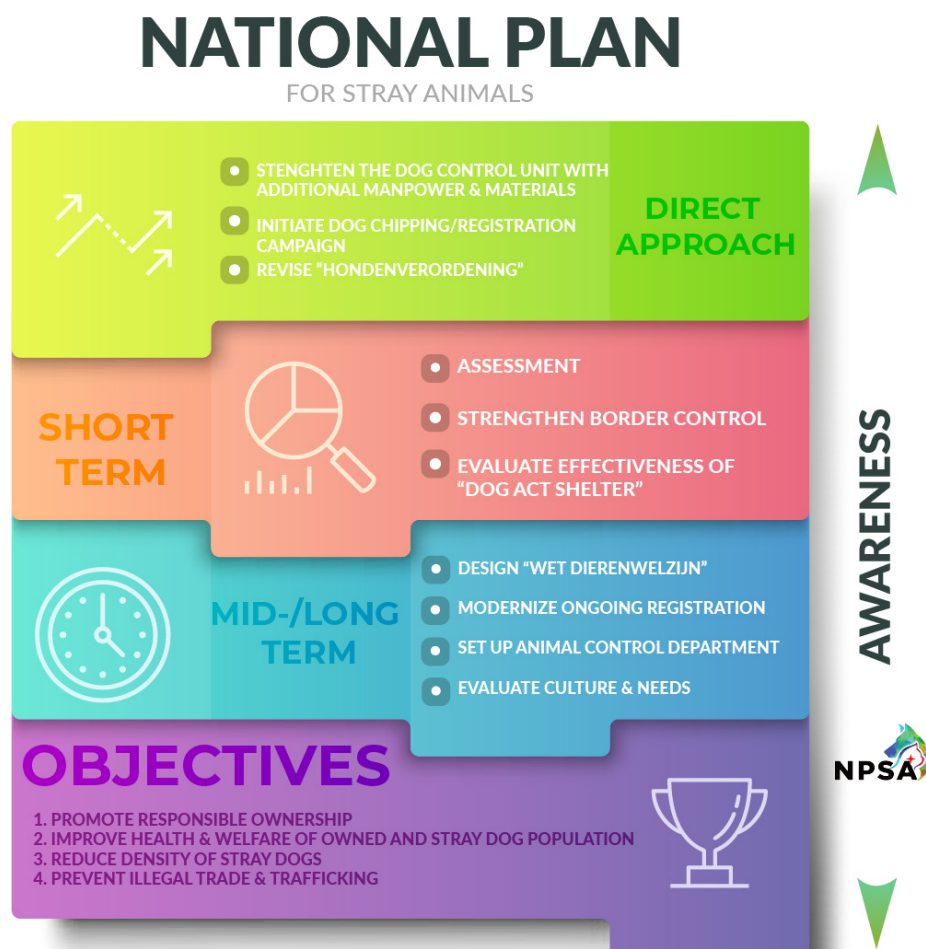
Figuur 2: NPSA

In onderstaand figuur is er schematisch het aangepaste plan van aanpak weergegeven.